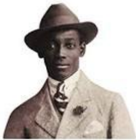
Anton de Kom, de Surinaamse slavenzoon

Die mocht ongedoopten vangen, ketenen en via centrale distributiecentra vervoeren. Onder meer bij El Mina bij het grote koninkrijk Ghana. Niemand keek er van op. In 1713 nam Engeland een van die monopolies over. Het werd de machtigste staat op zee tot 1942. Het verdiende flink. Daarom kon het de beste oorlogsvloot ooit constant in de vaart houden. Het drong de Hollanders en de Zeeuwen weg.