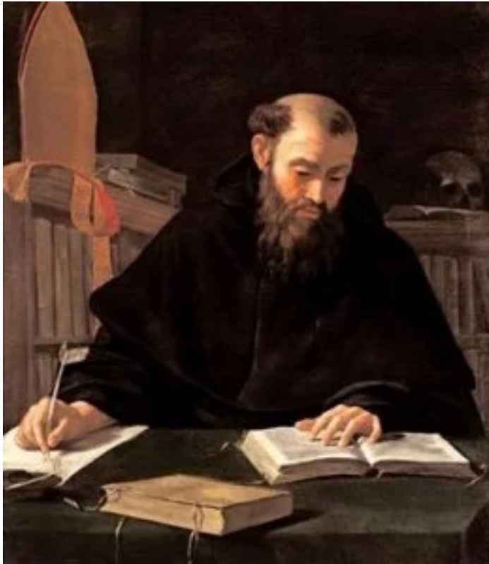
Sint Augustinus de Kerkvader

De slaaf was een handelsgoed. Maar je moest er toch netjes mee omspringen. En je mocht de slaaf niet zomaar doden. Dat vond Thomas van Aquino, de middeleeuwse kennisfilosoof ook. Bartolus. De internationale rechtsgeleerde, die omschreef wat er in transportovereenkomsten moest staan als een burger van een stad een kudde slaven overdeed aan iemand van een andere stad.