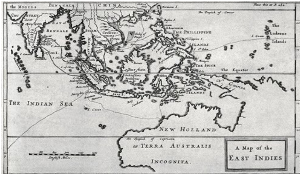
Nederlands koloniaal bezit in het Verre Oosten

Welke rol speelde daarbij het biotisch-biologisch evolutionisme van iemand als Charles Darwin? Waarom waren de Britten daar zo gek mee en de Duitsers aanvankelijk niet? Was koloniseren wel mogelijk zonder een slavensysteem? Waarom vervoerde de Verenigde Oostindische Compagnie slaven eigenlijk niet als lading en de West-Indische Compagnie, de West-Indian- en de English (Far) East Company juist wel?