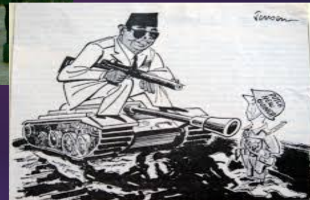
„Hoe K.A.N. ik nu imperialistische bedoelingen hebben? IK, ben ook niet Mand.“ (Overgenomen uit „London Sunday Telegraph“)