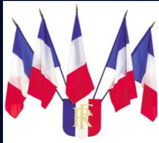
Visite de la délégation Française le 27 Février 2007