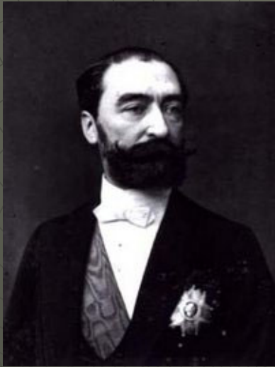
President Carnot, Frankrijk 24-6-1894