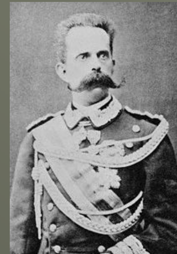
Koning Umberto I Italië 29 juli 1900