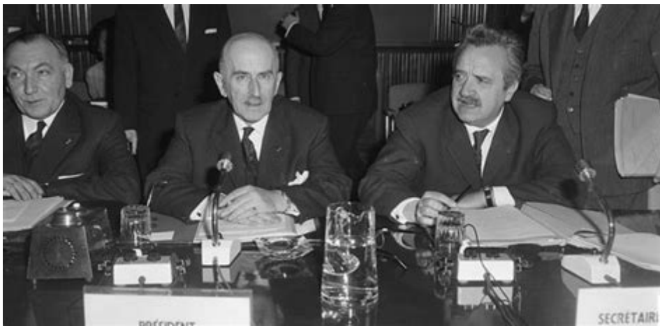
Oprichting van de Europese Economische Gemeenschap

De bouwstop die nu ineens werd aangezegd bleek een forse streep door de rekening. Dat Den Haag erdoor echt overvallen werd is onwaarschijnlijk. Wie het Brusselse schemercircuit van lobby-isten kent en hun niet aflatende inzet en druk op de ambtelijke beslissers in de voorportalen weet dat deze wending al vanaf 1975 voorbereid moet zijn, reeds omdat zoveel belanghebbenden met commerciële interessen bij die stop zijdelings betrokken moeten zijn geweest. Waaronder verzekeraars en banken. Dat er iets niet kón kloppen volgde al daaruit, dat Brussel de stop mede aanpreeps vanwege de borging van de concurrentiepositie van derde-wereldlanden op hun vooronderstelde mondiale markt.