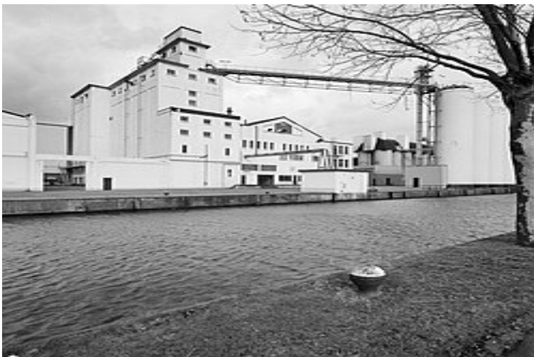
De Coöperatieve Handelsvereniging van de Noordbrabantsche Christelijke Boerenbond aan de Zuid-Willemsvaart te Veghel

Er was na afloop altijd bier en daarna alweer brandewijn-met-suiker, dat hielp geducht. Waarom zou de boer ook geen weekje met vakantie kunnen? Trouwhartig keken verastreerder, kassier en geestelijke de boer aan: hij moest de zonzijde van het leven herkennen als eenieder en breng eens een bloemetje onder de mensen. Gods beste zegen was met de boer, zei de deken die speciaal hiervoor uit Veghel was overgekomen nog afrondend. Maar je moest natuurlijk wél met de genade gods mee willen werken. De pastoor kon je daarover meer vertellen. Dat kunnen pastoors altijd. Of beter: dat kónden ze destijds. Toen het geestelijk gezag alles wist. En overal verstand van had. Dat kon je aan de Deken ook goed merken. Die had dan ook een gouden knop op zijn wandelstok.