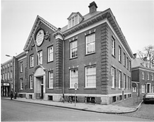
Centrale Boerenleenbank aan de Eindhovense Raiffeissenstraat

gewoonweg sprake van een tunnelvisie. Bij iedereen. Niet bij de experts. Maar die praatten ook toen al ingewikkeld en vertelden ook nog eens onaangename dingen. Zoals nu. En altijd. Tot in de eeuwen der eeuwen. Schaalvergroting en mechanische industrialisatie waren de toverwoorden.