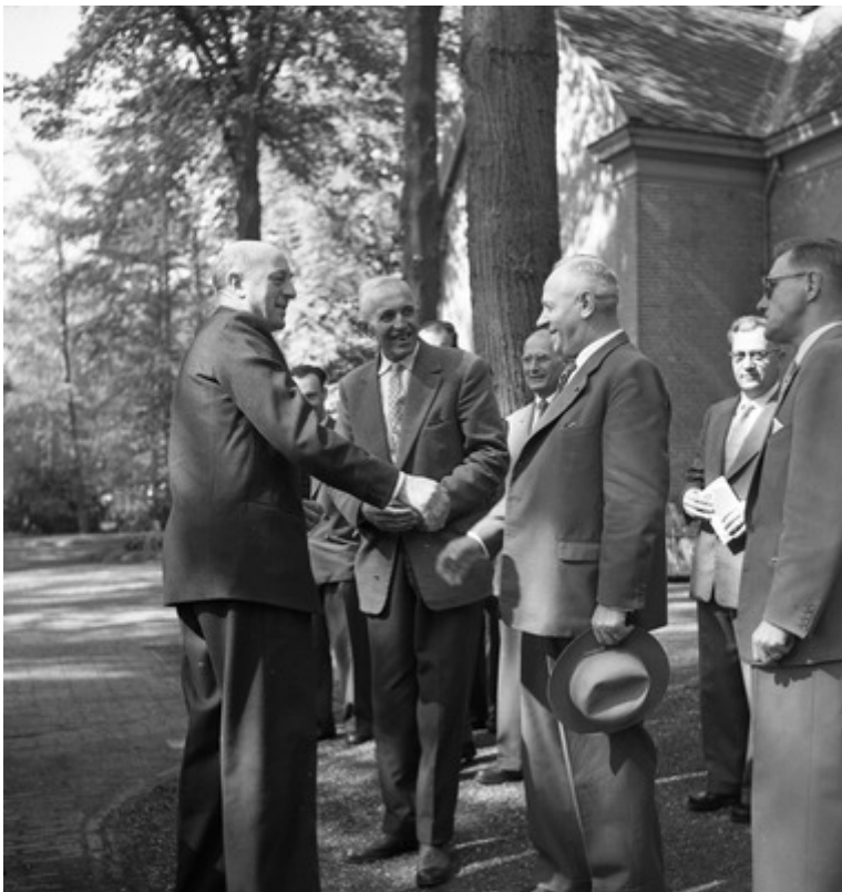
Mansholt bij een verkaveling

In Den Haag zat een Friese heerboer op de portefeuille van de minister van Landbouw en Veeteelt, zekere Sicco Mansholt. Die had besloten dat de boeren, eventueel onder dwang, zouden komen tot onderlinge ruilverkavelingen zodat ze grotere grondpercelen aaneengesloten machinaal zouden kunnen gaan bewerken met het oog op grote veldoogsten en verder enkele kavels zouden bezigen als bouwgrond voor enorme stallen met ingenieuze gemechaniseerde voedseldistributiesystemen, gevoegd, op hun beurt, door hoogoprijzende silo's.